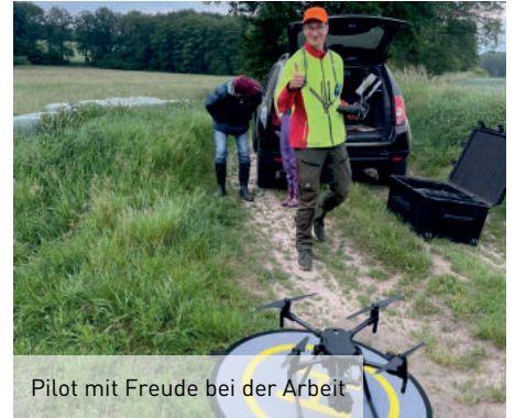
Pilot mit Freude bei der Arbeit

Wir sind froh, dass wir mit euch zusammen so viele Kitze finden und retten konnten, dass die Technik uns nicht im Stich gelassen hat und alles heile zurück ist.