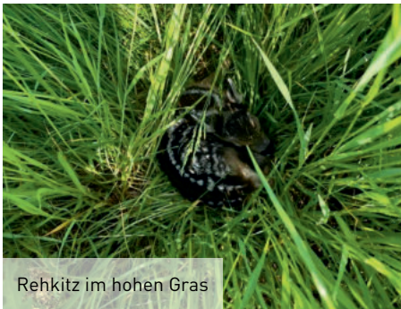
Rehkitz im hohen Gras

In diesem Jahr starteten wir unsere ersten Flüge am 04.05.2023 mit Ackergras und Grünroggen und flogen kontinuierlich bis zum 12.06.2023.